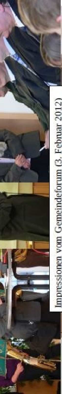
Impressionen vom Gemeindeforum (3. Februar 2012)